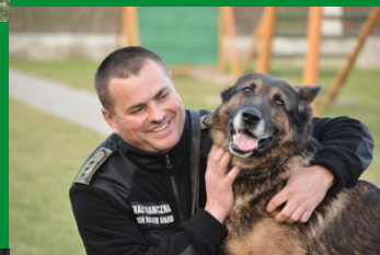
Przewodnik psa służbowego