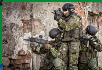
Funkcjonariusz do zadań specjalnych